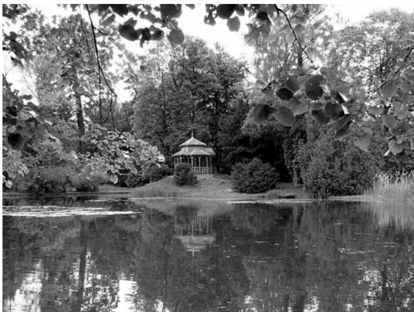
Chinesischer Pavillon am grossen Weiher im Ballypark

Bitte reservieren Sie sich den 22. März 2014 für unsere Generalversammlung und das interessante Rahmenprogramm.