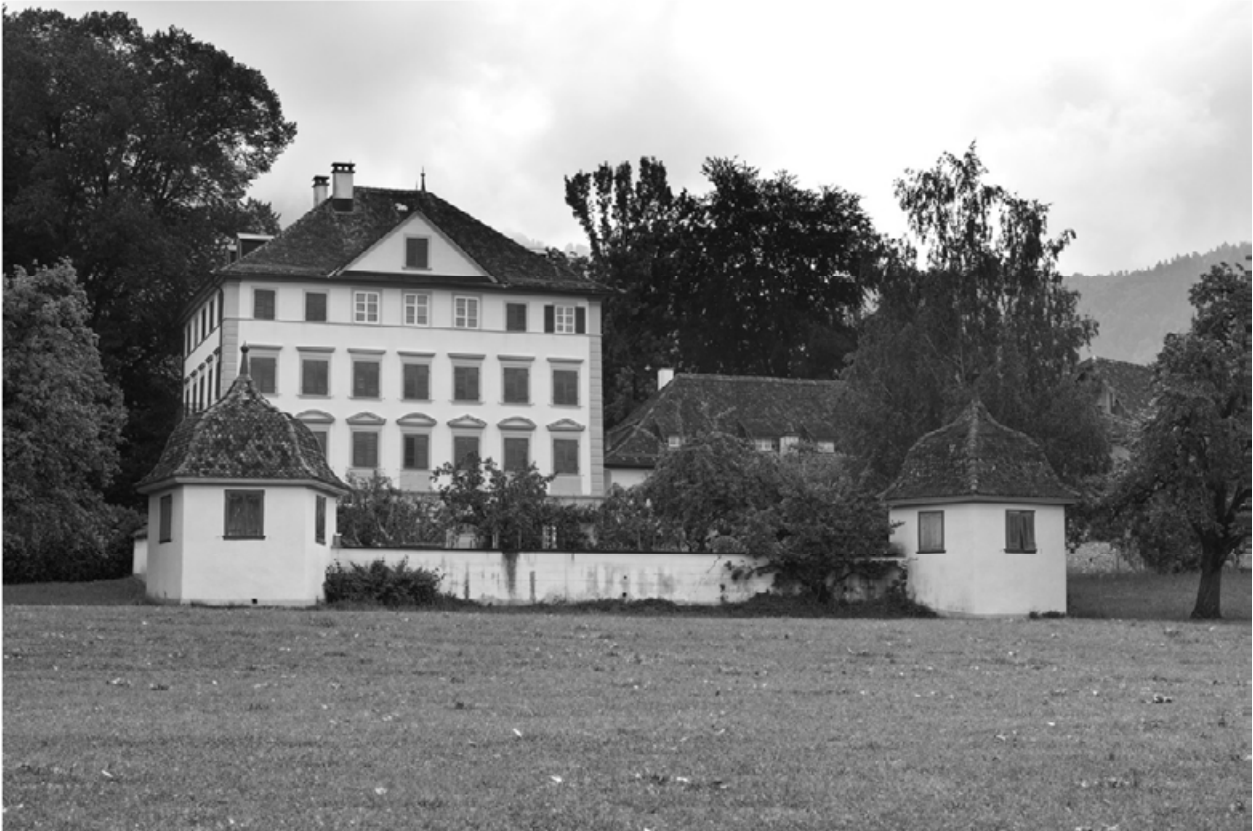
Abb: Haus Ab Yberg

Führung durch Italo Reding Haus und 2 Schwyzer Herrenhaus-Gärten