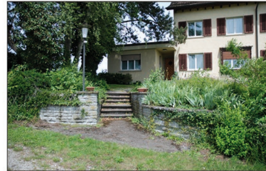
Garten Gamper, 1947

Die drei mittelständischen Gärten sind im Abstand von je 15 Jahren entstanden, 1947, 1962 und 1977. Sie wurden seither nicht wesentlich verändert und sind bei den Bewohnern weiterhin sehr geschätzt.