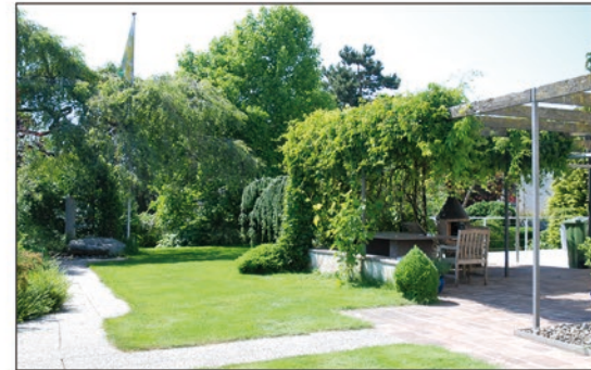
Garten Wiget (chem. Herzog), 1962