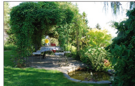
Garten Kurz, 1977