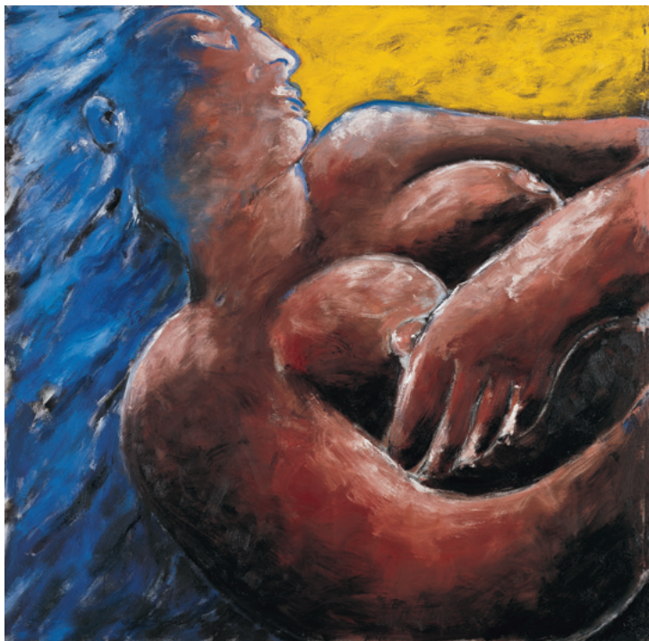
Dieter Hacker Die Quelle 1984 Öl auf Leinwand Oil on canvas 200 x 200 cm Sammlung Würth, Inv. 2164