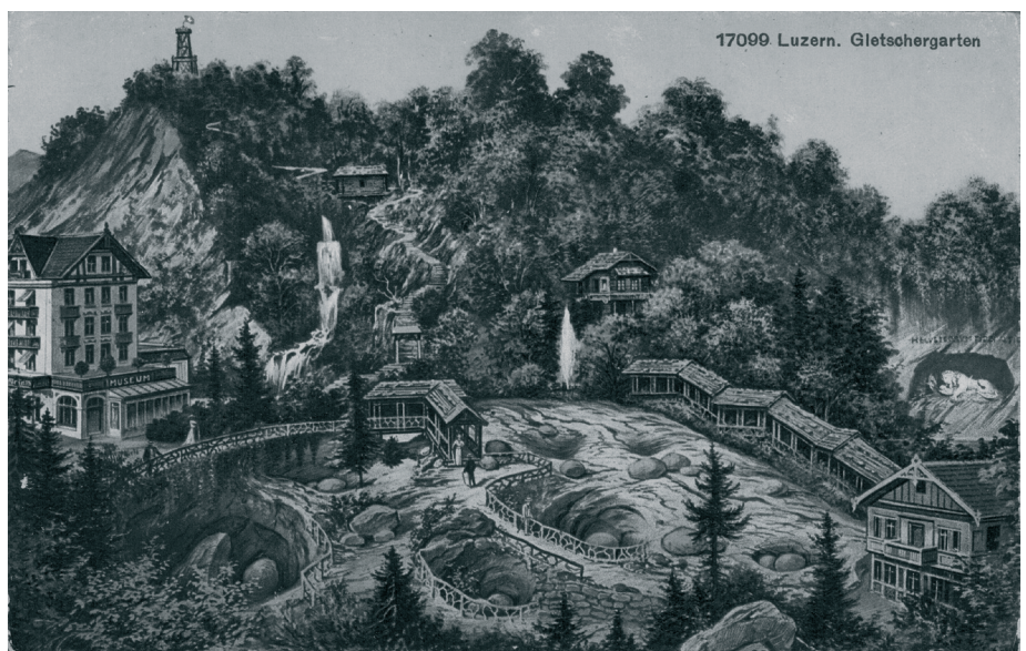
Ansichtskarte des Gletschgartens und des Löwendenkmals, um 1920

Anreise mit dem Auto: Autobahn-Ausfahrt «Emmen- Süd» benutzen. Es sind allerdings keine Parkplätze im Umfeld des Restaurants vorhanden.